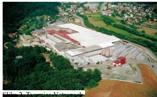
Slika 2. Tvornica Vetropack

Kroz narednih desetak godina u tvornicu je uloženo oko 600 milijuna kuna. U to vrijeme u Hrvatskoj su prevladavala brojna privatna poduzeća gdje su većina njih i propala. No, Vetropack Straža je uspjela. Razlog tog uspjeha, jest to što je Vetropack ponudio moderan menadžment i drugačiju organizaciju, a uz to je znao iskoristiti tradiciju. U